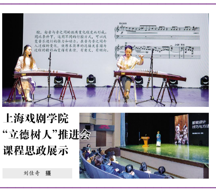
上海戏剧学院“立德树人”推进会课程思政展示

和奉献,鼓舞和影响舞蹈学子们守住初心,耐住寂寞,持之以恒。每天清晨,教室里已经传来了老师们严厉的声音,每个夜晚,总有那么一些老师,依旧在教室和学生在一起排练、创作。周末,舞蹈学院的教室里随处可见的是老师的身影;寒暑假,为了把学生推向舞蹈比赛的最好水平,为了创作更好的作品,老师们依旧坚守在教室。我们在通过艺术作品的排练告诉学生,艺术之真的基础首先就是基本之真。 立德树人先在于“立德”,对于我们艺术院校的老师而言,也是教师自身先要做到有好的德行,在艺术实践中,用自己的一言一行去感染和影响学生。用自己的艺术观和价值观影响学生,让他们懂得如何坚守和发扬艺术的价值,从而影响更多的人。